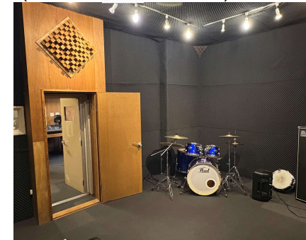
(レントゲン室→音楽スタジオ)