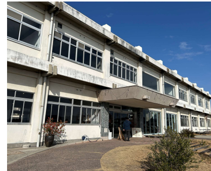
(施設外観に大きな変化はない)