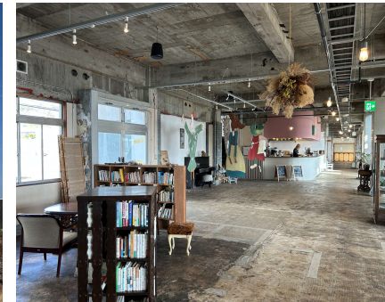
(廊下と受付→広場+カフェ)