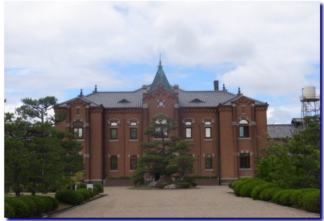
国重要文化財 旧奈良少年刑務所