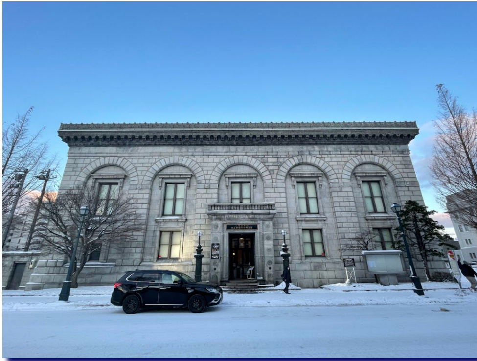
国重要文化財 似鳥美術館(旧三井銀行小樽支店)