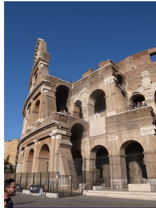
コロッセオ(ローマ)