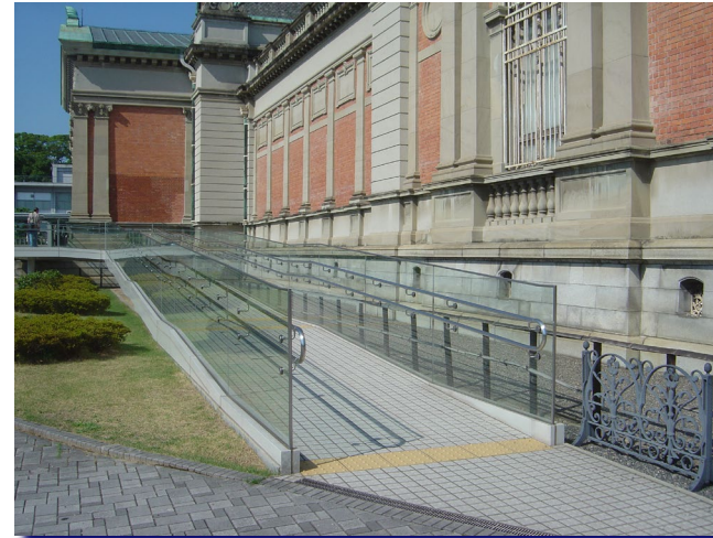
京都国立博物館 本館