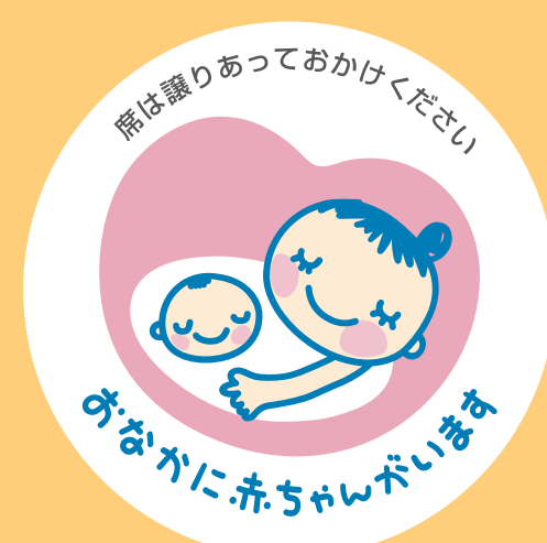
マタニティマーク