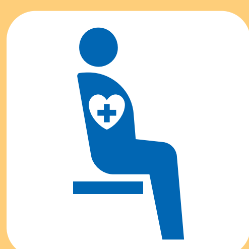
内部障害のある方