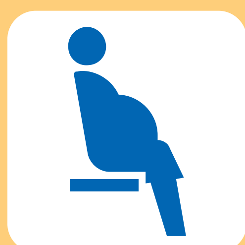
妊娠されている方