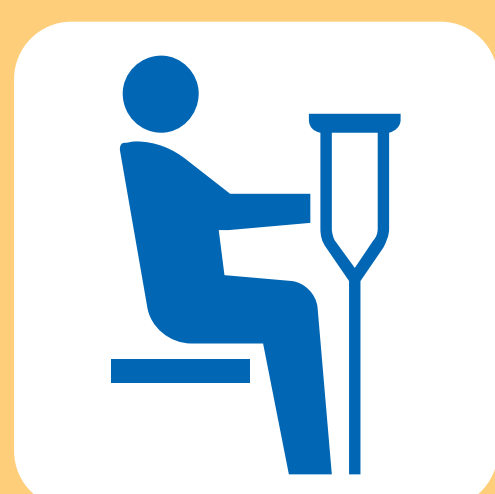
障害のある方 けがをされている方