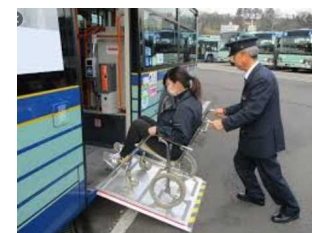
路線バスにおける役務提供 (スロープ設置・介助)の例