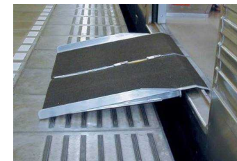
駅ホームにおけるスロープ板設置の例