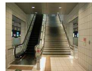
階段脇の位置を わかりやすく示す照明の例