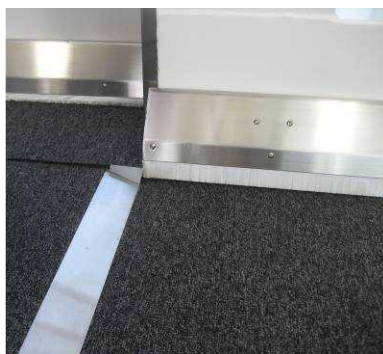
搭乗橋のつなぎ目部分の段差を解消