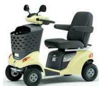
④ハンドル形電動車椅子