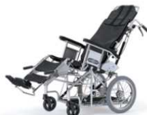
⑤座位変換型車椅子