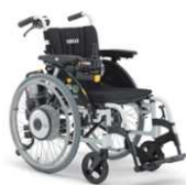
②簡易型折りたたみ式 電動車椅子