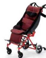
⑥子供用車椅子 (福祉バギー・バギーカー)