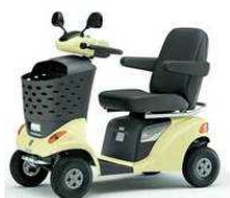
④ハンドル形電動車椅子