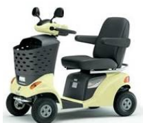
④ハンドル形電動車椅子