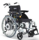
②簡易型折りたたみ式 電動車椅子