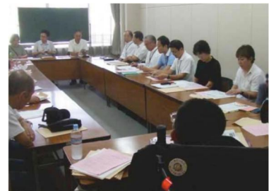
土浦市の担当者も参加した勉強会

土浦市では、バリアフリー新法に基づく住民提案制度ができる前から、市民団体がまちのバリアフリー化に向けた取組みを進めていました。電車やバスの乗車点検、シンポジウム、勉強会などを経て作成された基本構想（素案）が、平成 19 年 7 月に市へ提案されました。