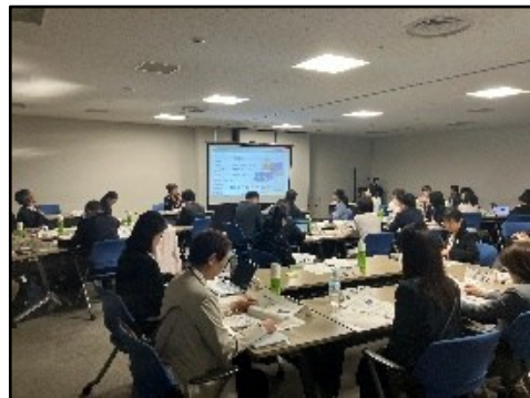
▲国土交通ジェンダーネットワーク会議の様子(R8.4) ※民間企業・団体、国交省職員等が参加。