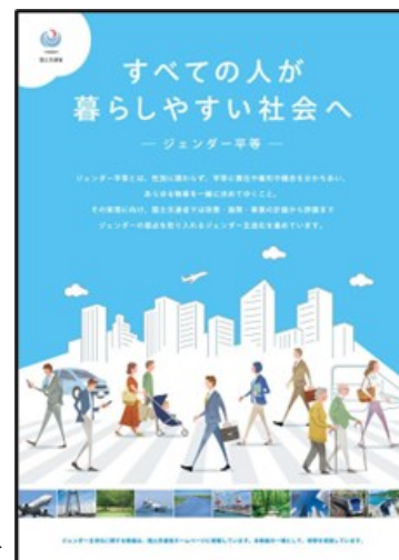
啓発ポスターの掲示(R8.1)▶