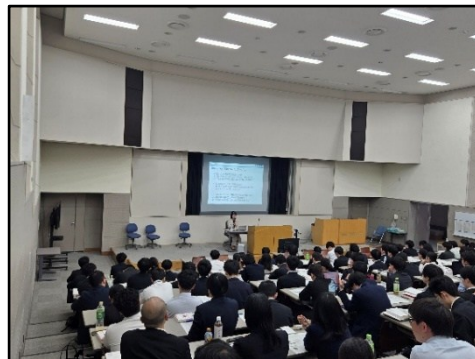
▲新規採用職員研修における講義の様子(R8.4)