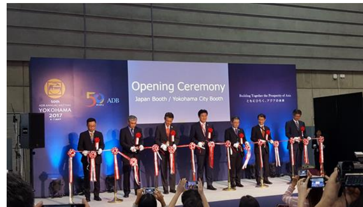
日本ブース・横浜市ブース オープニングセレモニー