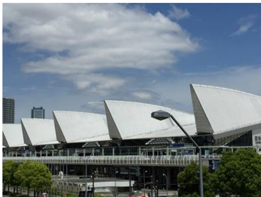
展示会場(パシフィコ横浜)

※加盟国67の国・地域から、財務大臣・開発大臣、中央銀行総裁、および金融機関関係者、民間企業、学識経験者、メディア・報道関係者、CSO市民団体関係者などが参加する国際会議(参加者3,000名～4,000名)