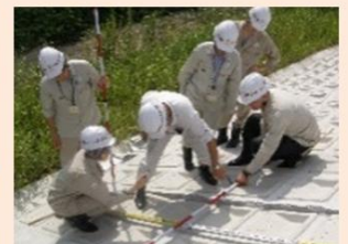
地域における技術者派遣の仕組みづくりの支援