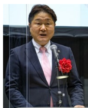
稲城市市長 高橋 勝浩