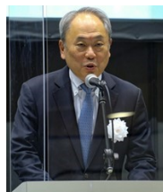
会長 富山 和彦