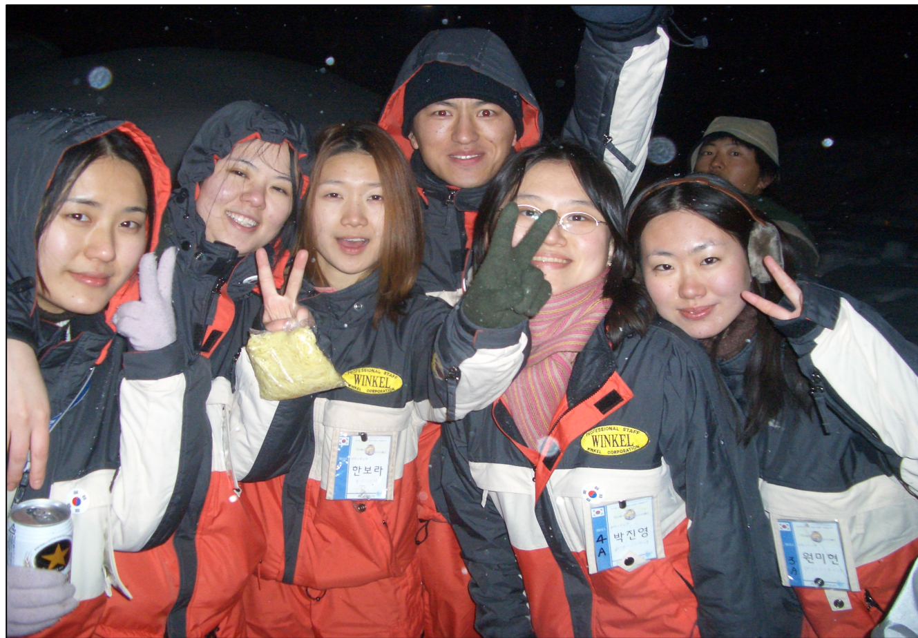
「小樽雪あかりの路」韓国人ボランティア

市民手作りのイベントである「小樽雪あかりの路」は、毎年、韓国をはじめ、海外から多くのボランティアが参加する人気イベント。小樽運河では、約400個の浮き玉が幻想的な雰囲気を創出している。また、ガラス細工やオルゴール展示・制作体験などのまちめぐりにも人気を博している。外国人宿泊者延数は、平成18年43,110人で平成13年の約3倍に！