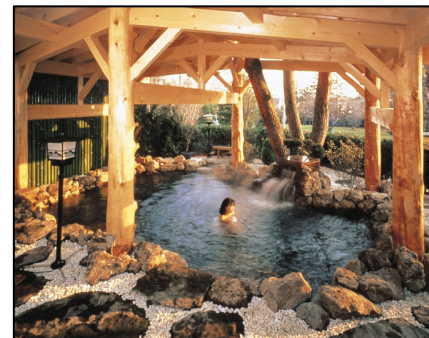
朝里川温泉の露天風呂