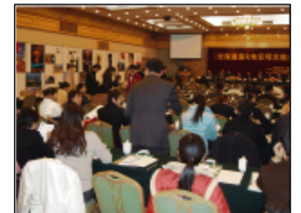
中国杭州でのプロモーション

平成8年から他に先駆け、東アジアを中心とした観光プロモーションを実施し、その後、広域で連携した観光プロモーションに取り組んでいる。