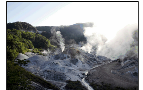
湯けむりを上げる「地獄谷」

約1万年前、笠山が噴火した時の爆裂火口跡。谷に沿って数多くの湧出口や噴気孔があり、その面積は11ヘクタールに及ぶ。泡を立てて煮えたぎる風景が「鬼の棲む地獄」と言われたことが名前の由来。