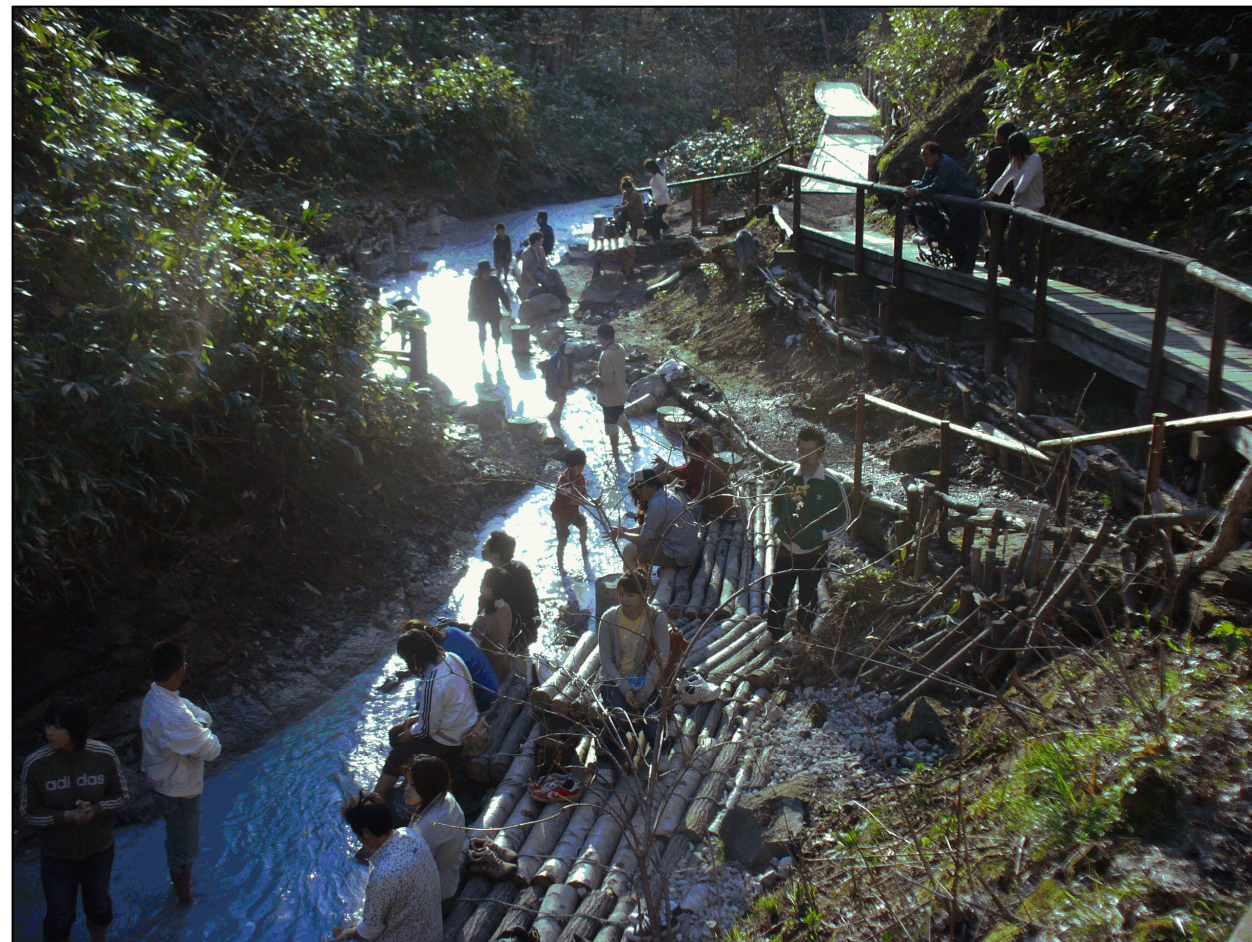
大湯沼川探勝歩道

登別温泉は硫黄泉や食塩泉、鉄泉、明ばん泉など世界的にも珍しい多種類の温泉が湧出しており日本有数の温泉地として魅了。国内ばかりでなく多言語による情報発信や積極的なPR・誘致活動等で、年々外国人観光客が増加。