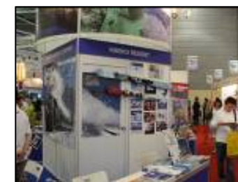
シンガポールでのプロモーション

倶知安・ニセコの行政機関と経済団体、観光事業者が結集し、有限責任中間法人ニセコ倶知安リゾート協議会を発足させる。「NISEKO」というブランドを世界に発信するプロモーション組織で、豪州・アジアをはじめ世界にPR活動を展開する。