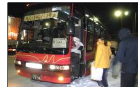
くっちゃんナイト号

冬季における域内交通(二次交通)は、路線バスのほか、スキー場間を連絡するニセコフリーパスポート号、温泉施設を行ける湯めぐりバス、夜間に倶知安市街地に行けるくっちゃんナイト号の運行など観光客への利便性は高く、車内アナウンス、停留所表示、PRパンフレットは日本語と英語で対応している。