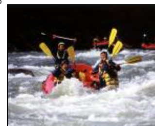
自然を満喫できる「ラフティング」