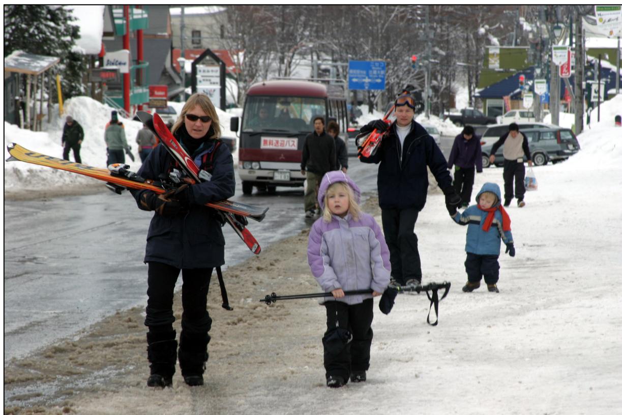
家族で訪れる外国人

豪州人スキー客がパウダースノーの魅力を見出し、情報発信。豪州客の急増及び外国人投資による地域活性化が進んでいる。加えて外国語対応の標識や海外へのプロモーション活動を行うなど両町をあげて外国人の誘致に取り組み、平成18年には平成14年の約9.4倍の11.6万人の外国人が宿泊。