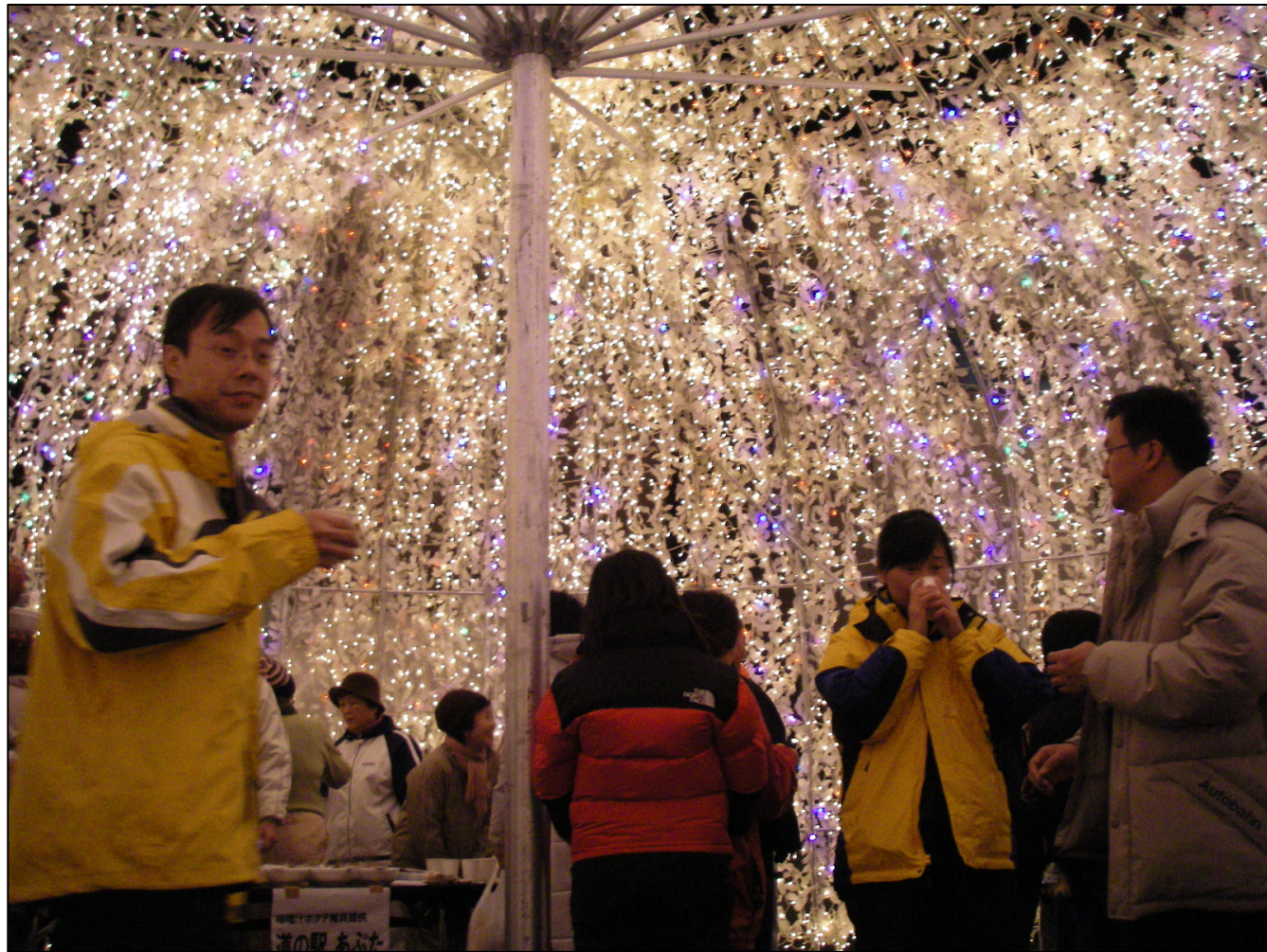
「洞爺湖サミット200日前イベント」でのイルミネーショントンネル(台湾観光客)

火山、湖、温泉など自然の魅力を背景に洞爺湖でのカヌー、中島トレッキング等、英語対応も可能とした体験プログラムを提供するとともに、海外プロモーションを積極的に実施し、平成18年には平成15年の約2倍の約20万人の外国人が宿泊。