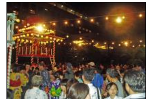
外国人も参加する洞爺湖温泉夏祭り(盆踊り)

洞爺湖温泉では観光客を誘致するため取り組みとして1ヶ月間のロングラン「夏祭り」を開催。英語によるチラシも作成し、多くの外国人観光客も参加している。