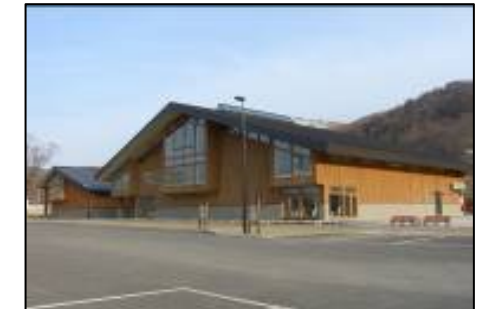
洞爺湖ビジターセンター・火山博物館

有珠山の火山活動によって誕生した洞爺湖温泉であるが、洞爺湖ビジターセンター・火山科学館はその歴史を多言語化(英語・中国語・韓国語)で解説し、外国人も多く訪れている。