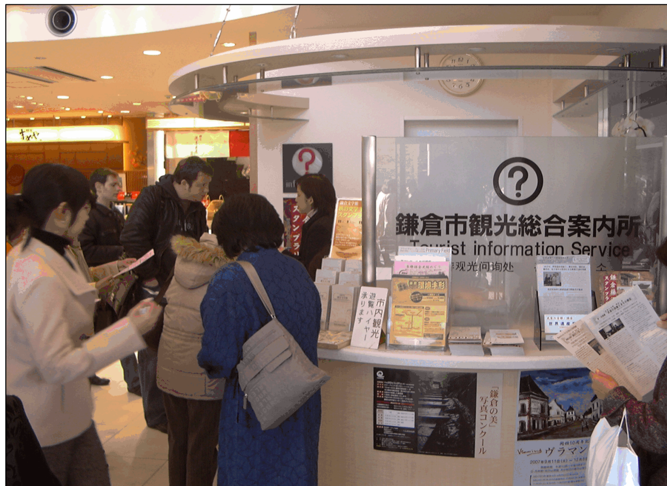
観光案内所を訪れる外国人旅行者

鎌倉時代に武士のまちとして栄えた古都鎌倉は、相模湾を南面に三方を山に囲まれた自然の要害。首都圏からのアクセスも便利で、鎌倉時代から残る社寺や海が望める風光明媚さが大きな魅力。アメリカやフランスからの観光客に人気。ホスピタリティの向上を目指した取り組みもある。