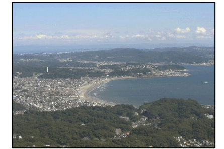
上空からの鎌倉市内

鶴岡八幡宮や大仏といった建造物が点在する、日本の歴史・文化に触れられる観光地。都心から近いうえ、交通アクセスもよいため、ビジネスで日本を訪れる外国人からも人気。