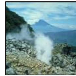
大涌谷から富士山を望む