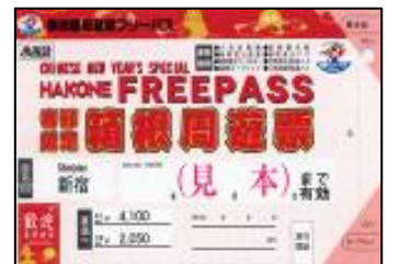
春節限定箱根フリーパス

小田急グループでは、東アジア地域からの観光客を歓迎するため春節の時期に「春節遊客キャンペーン」として割安な外国人旅行者専用のフリー切符(春節限定箱根フリーパス)を販売。また、箱根登山バスの「箱根施設めぐりバス」では、車内の2カ国語(日・英)放送、案内表示等を実施。電車、ケーブルカー、ロープウェイ、バスなどの案内板デザインの統一化や箱根湯本駅での旅行荷物のホテル・旅館等への搬送サービス(有料)の案内を4カ国語(日・英・中・韓)で実施。