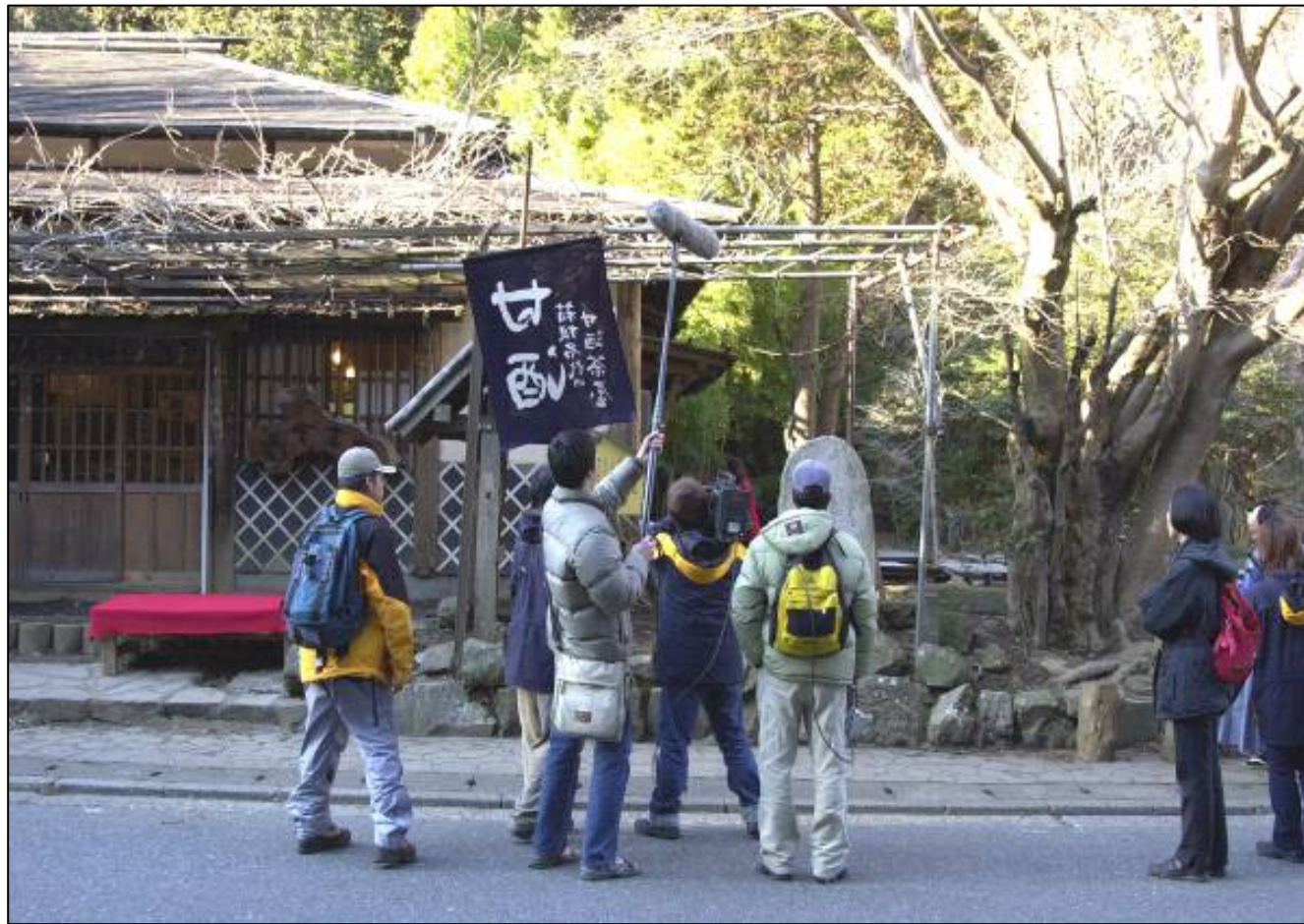
台湾TVメディアによる撮影風景

都心からアクセスが便利で富士山、芦ノ湖をはじめとする自然資源、名所旧跡が残る古くからの外国人保養地の1つ。プロモーションや外国語対応にも力を注ぎ、年間の外国人宿泊者数は10万人を超える。