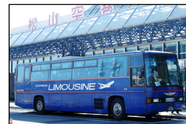
空港と市内を結ぶリムジンバス

行政、観光産業、大学とNPOソフィア倶楽部が連携し、地域が一体となった体験交流型観光の地域ネットワーク化を図るとともに、友好都市ピョンテク市(韓国)や愛媛県と姉妹提携しているハワイ州(米)からの訪日教育旅行の受入を促進。(VJC地方連携)