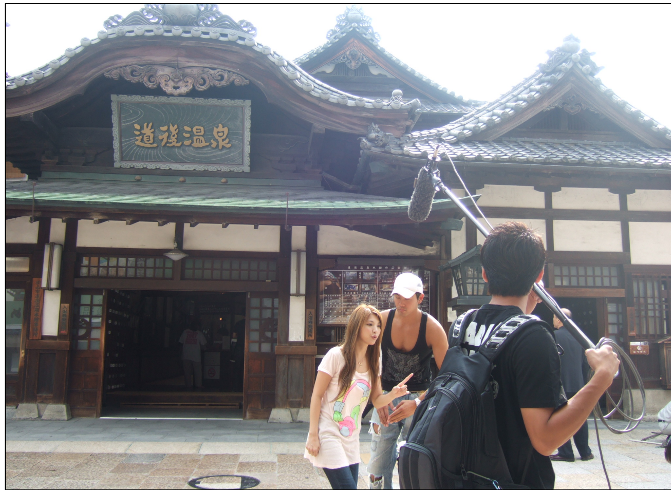
台湾TV局によるロケ