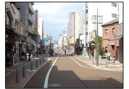
ロープウェイ通り