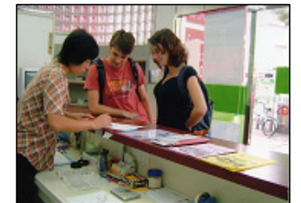
案内所での外国人観光客に対応の様子

別府外国人観光案内所では通訳ボランティアの協力を得て、英語や韓国語で、お年寄りや家族連れ、外国人観光客にやさしく対応している。