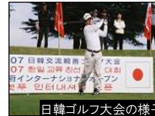
日韓ゴルフ大会の様子

泉質は世界中にある11種類のうち、放射能泉を除く10種類の泉質の温泉が別府で楽しめる。入浴法や温泉の活用法も多彩。