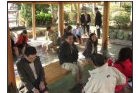
海地獄:「足湯」を楽しむ招聘事業で台湾から訪れた企業・旅行社

宿泊施設・観光施設が合同で温泉・ゴルフ等について、韓国・台湾・中国へ誘客活動を実施。