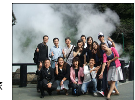
招聘事業で台湾から訪れた旅行関係者

外旅協では、平成9年から外国人旅行者の誘客の取り組みを継続的に進めている。平成14年度から本格的に韓国、平成16年度からは積極的に台湾からの誘客も始めた。現在、VJC地方連携事業では韓国・台湾のほか中国からの旅行・マスコミ関係者の招聘事業や別府市・宿泊施設・観光施設が合同でPR活動を行っている。