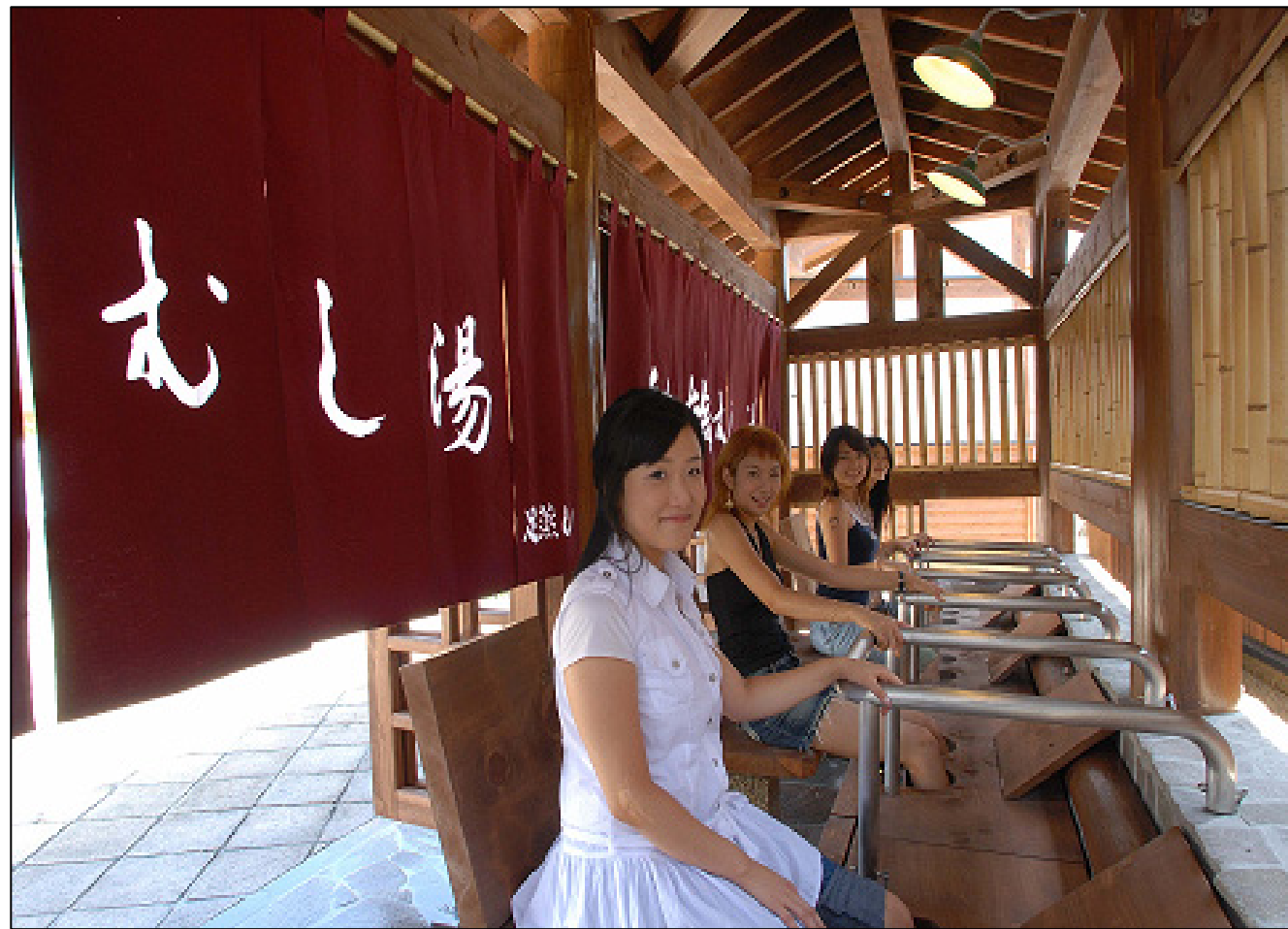
むし湯の足湯を楽しむ韓国からの観光客

温泉やゴルフ等の観光施設について、韓国への地道な誘致活動、外国人旅行者受入協議会と立命館アジア太平洋大学との連携、商店街の取り組みにより、平成18年には20万人を越える外国人延宿泊数(約8割は韓国人)。