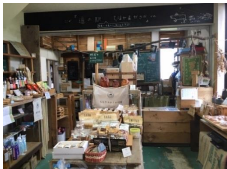
1 F お土産売り場・レジ