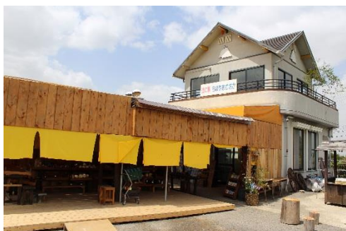
道の駅「ちはやあかさか」外観