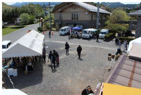
屋外イベントスペース