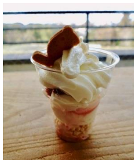
棚田カレーとデザート