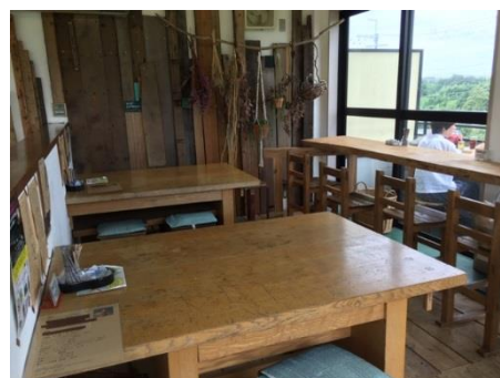
2 F カフェスペース (収容 15 人程度、別途テラス席あり)