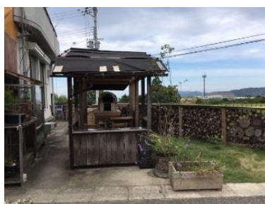
特設スタンド（いちご売り場）