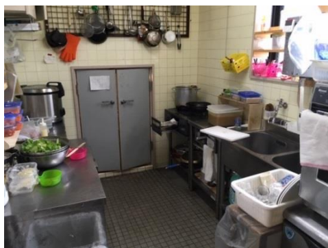
1 F キッチン