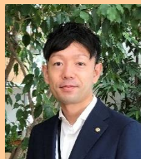
コーディネーター