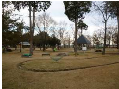
② ターゲットバードゴルフ場