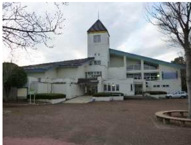
① コミュニティクラブハウス