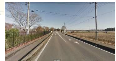
③公園東側道路