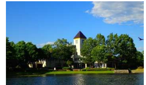
▲池とクラブハウス（管理棟）