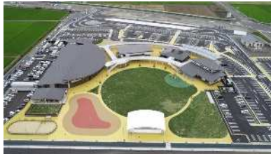
道の駅「グランテラス筑西」