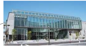
しもだて美術館 (約2万2千人)