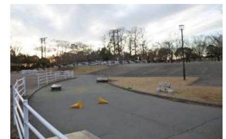
▲スケートボード場