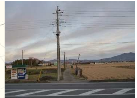
①公園南方面の田園風景