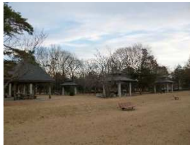
③ バーベキュー広場