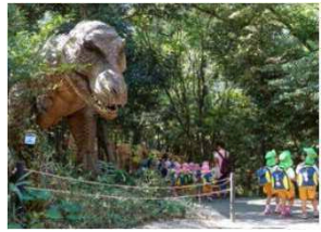
ディノアドベンチャー名古屋