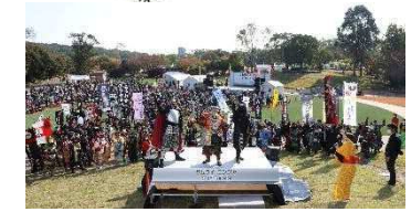
若草山芝生広場 サムライ・ニンジャ・フェスティバル2020