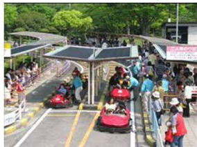
交通公園 (ゴーカート)