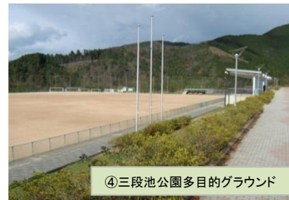
④三段池公園多目的グラウンド