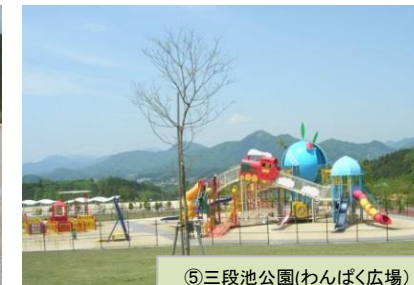
⑤三段池公園(わんぱく広場)