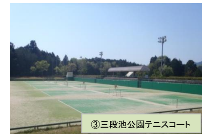
③三段池公園テニスコート