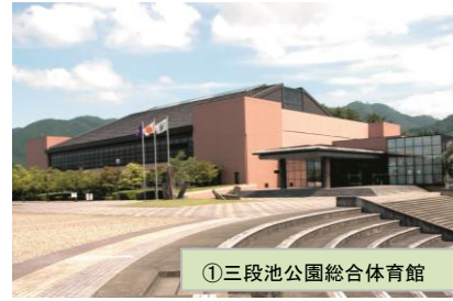
①三段池公園総合体育館