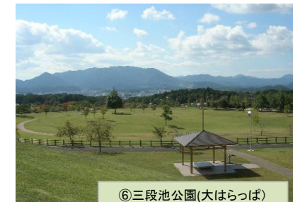
⑥三段池公園(大はらっぱ)