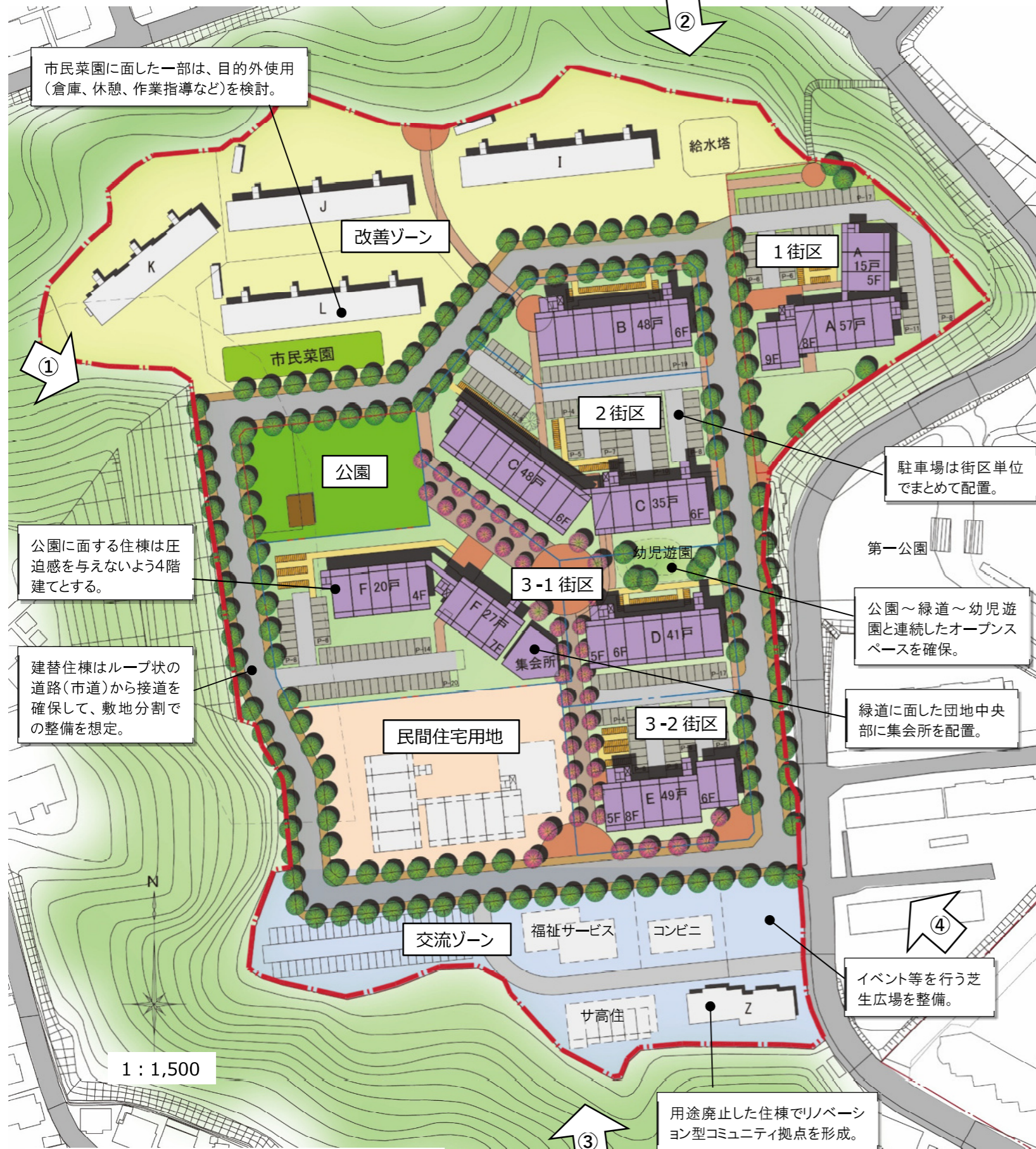
アルファベット群 配置計画案 S=1 : 1,500