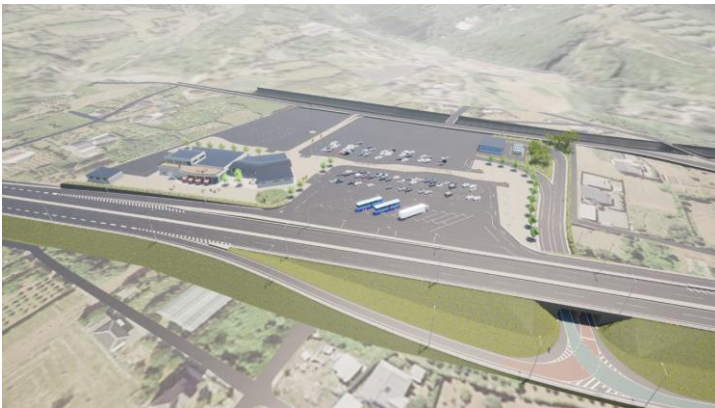
矢筈岳を望む鳥瞰図