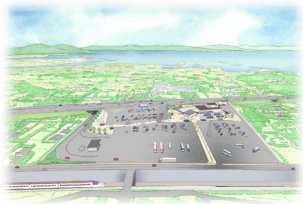
八代海（不知火海）を望む鳥瞰図