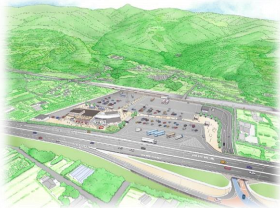
矢筈岳を望む鳥瞰図