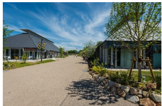
草津川跡地整備事業