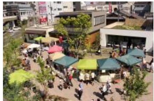
アニマート跡地賑わい空間整備事業