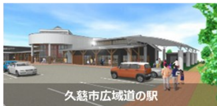
久慈市広域道の駅