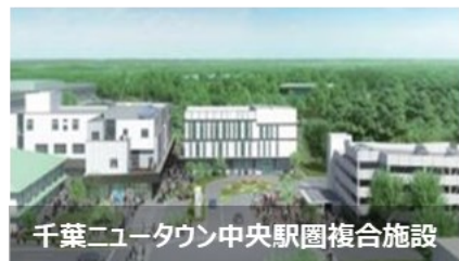
千葉ニュータウン中央駅圏複合施設