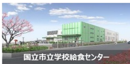
国立市立学校給食センター