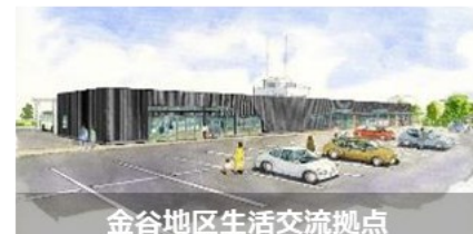
金谷地区生活交流拠点