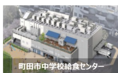
町田市中学校給食センター