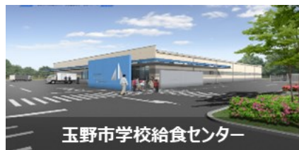
玉野市学校給食センター