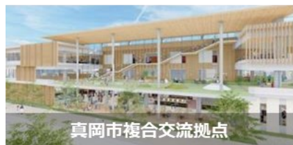
真岡市複合交流拠点