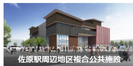
佐原駅周辺地区複合公共施設