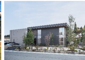
地域優良賃貸住宅