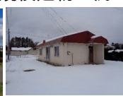
①旧高島小④青山地区コミセン③旧栗林医院③旧職員住宅⑤旧青山コミセン住宅