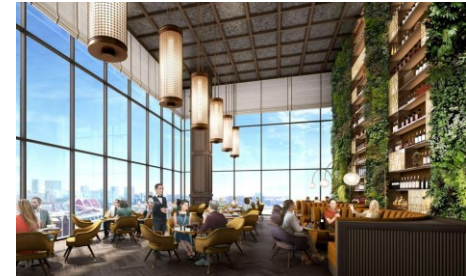
【参照】神戸市本庁舎2号館再整備事業