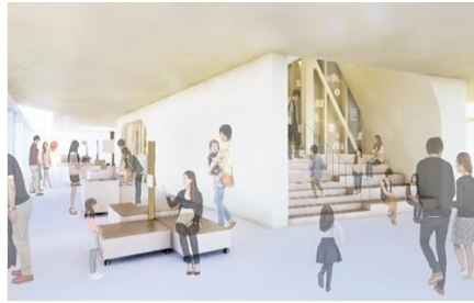
【参照】伊奈町新庁舎整備 実施設計