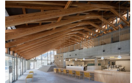
丹波山村庁舎 『グッドデザイン賞2024』受賞