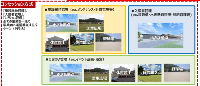
■図表5 分割管理方式