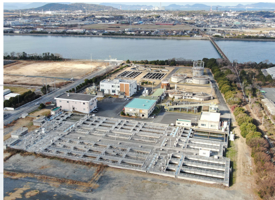
宇部市西部浄化センター全景