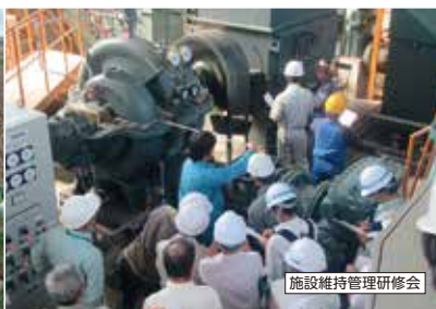
施設維持管理研修会