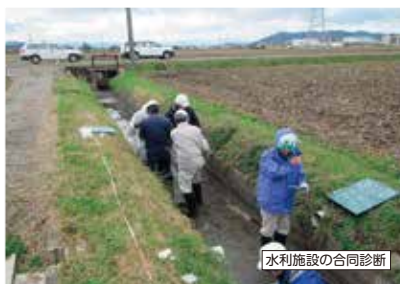
水利施設の合同診断