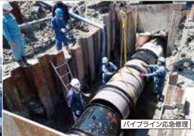
パイプライン応急修理