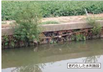
老朽化した水利施設