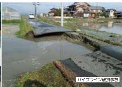
パイプライン破損事故