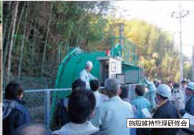
施設維持管理研修会