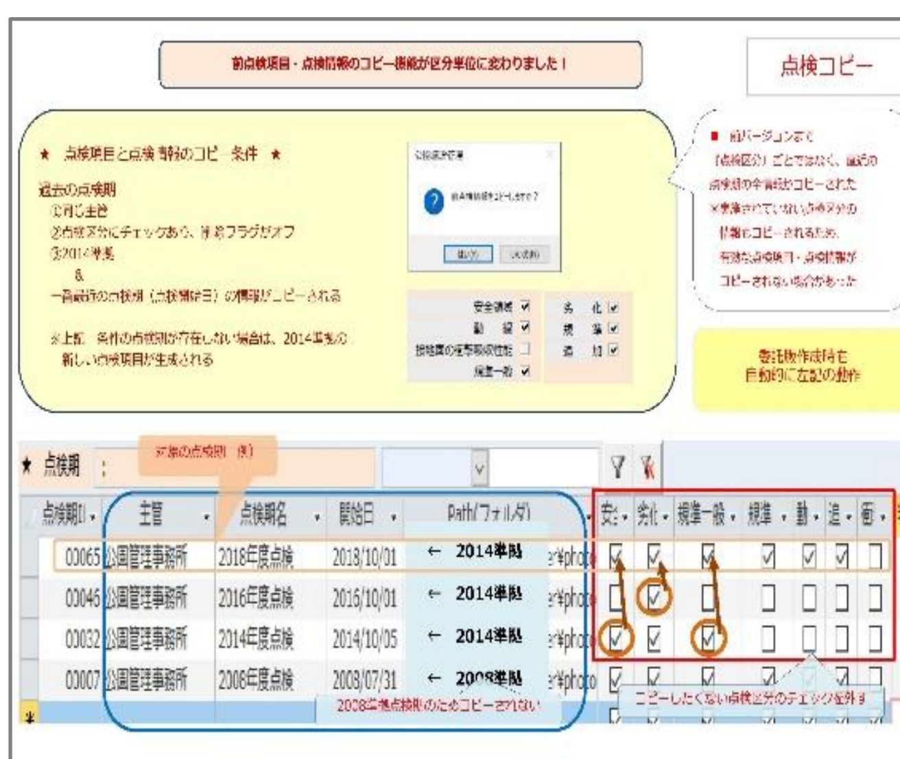
点検期のコピー機能