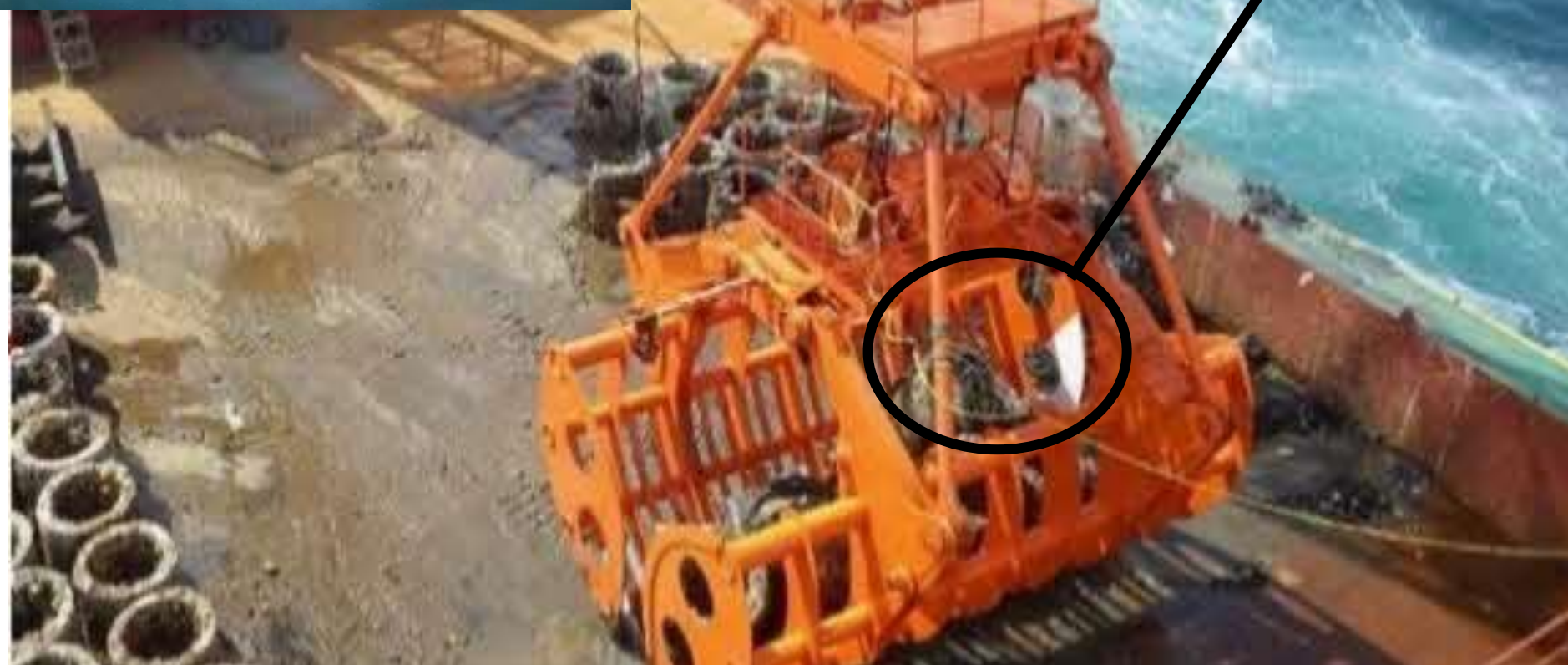
水中カメラ付特殊バケット