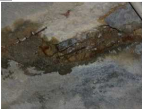
覆工コンクリートの剥落・貫通ひびわれ