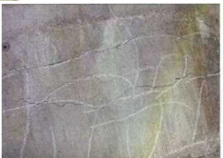
下部工のひび割れ