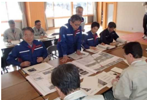
直轄診断後自治体に説明する様子