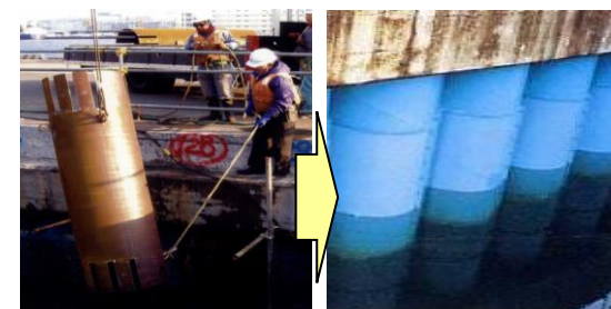
▲ 鋼管杭を鋼板で補強