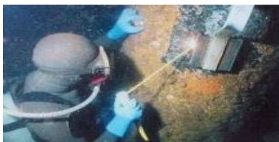
▲ 水中溶接による電気防食の施工