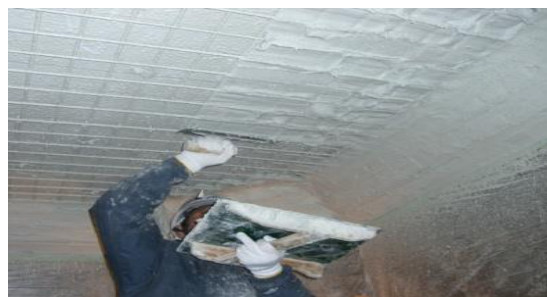
▲ 増厚工法による補強