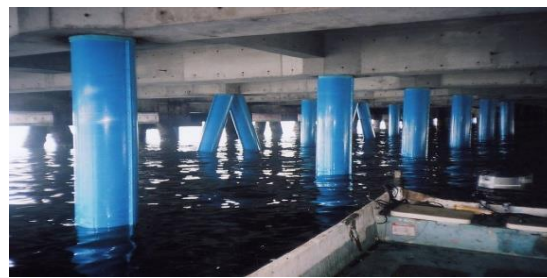
▲ ペトロラタムによる表面被覆