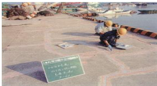
▲ エプロンのひび割れに樹脂を充填