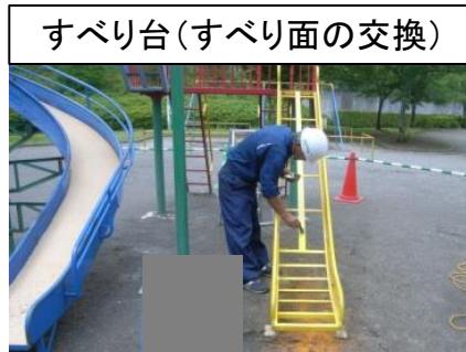
すべり台(すべり面の交換)