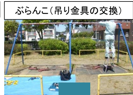
ぶらんこ(吊り金具の交換)