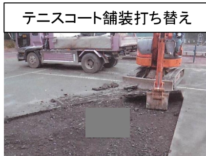
テニスコート舗装打ち替え