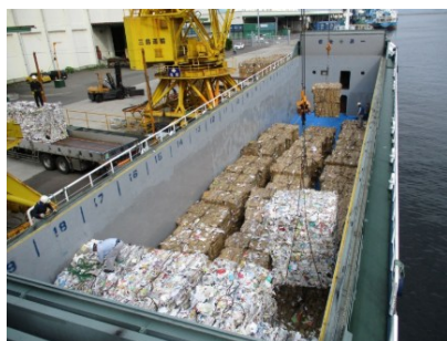
▲古紙・紙製品等のコンテナ化