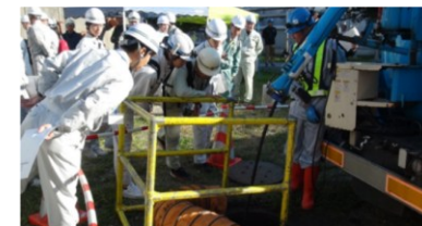
▲愛媛大学社会基盤メンテナンスエキスパート(ME)養成講座の様子