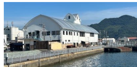
▲小松島みなとオアシス(徳島県)

徳島県小松島市の小松島みなとオアシスは、「小松島みなと交流センターkocolo」を中心に、市民の憩いの場と定期的なイベントでにぎわう場所として活用されている。