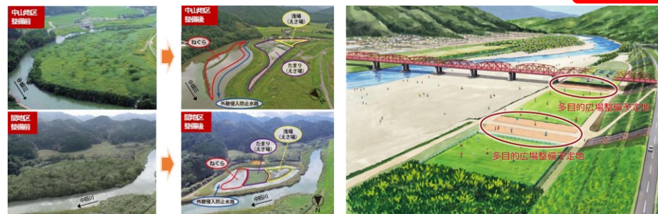
▲湿地環境の再生・創出の整備前後の状況（上：中山地区、下：間地区）