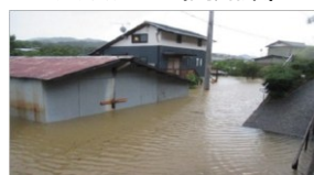
▲平成26年8月台風の様子（高知県の町加田地区）