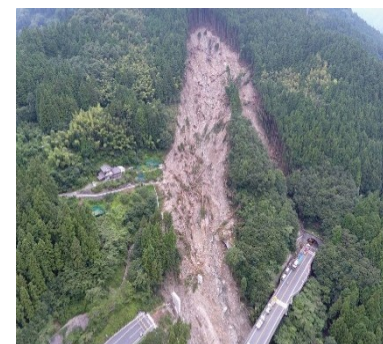
▲平成30年7月豪雨の被災状況