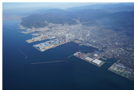
▲三島川之江港（愛媛県）

愛媛県の三島川之江港は、平成18（2006）年12月にリサイクルポートに指定され、古紙、バイオマス燃料（木くず、RPF）等の原材料の移入、および再生紙や土壌改良材等の移出の際に海上輸送拠点としての役割を担っており、全国規模での循環資源の広域流動を促進している。今後も、物流ネットワークの拠点となる物流機能や高度なリサイクル技術を有する産業の集積を有する港湾としての必要機能の整備に取り組むことにより、港湾を核とする広域的な資源循環ネットワークの強化を実現する。