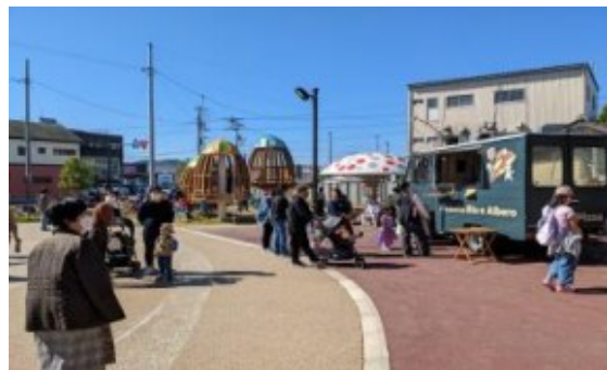
▲新たに整備された広場

高知県南国市では、コンパクト・プラス・ネットワークの深化に向けて、南国中央地区都市再生整備計画事業に取り組んだ結果、新たに整備された南国市ものづくりサポートセンター隣接広場においてマルシェイベントの開催やキッチンカーでの営業等が民間主導で行われるようになり、賑わいと都市活力が創出された。