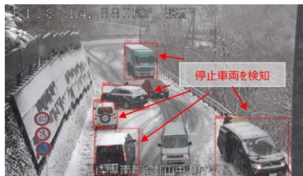
▲AI画像解析技術を用いた交通障害検知

CCTV映像の自動解析による交通障害の検知・通知に取り組んだ結果、道路異常の早期発見による早期処理効果が発揮され、交通事故、通行止め時間、管理瑕疵等の削減に資するメンテナンスの高度化が実現した。今後も、新技術を活用したインフラの管理・運用の促進に取り組むことにより、インフラの機能発揮の最大化を実現する。