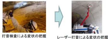
▲トンネル点検での活用例

トンネル点検等でロボットカメラやレーザー打音等の点検支援技術を活用することで、定期点検の高度化・効率化が期待される。