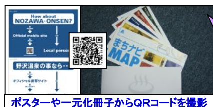
ポスターや一元化冊子からQRコードを撮影