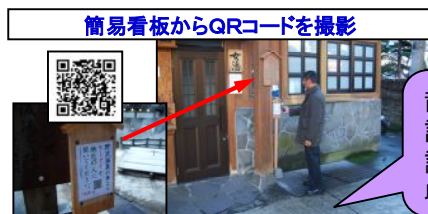
簡易看板からQRコードを撮影