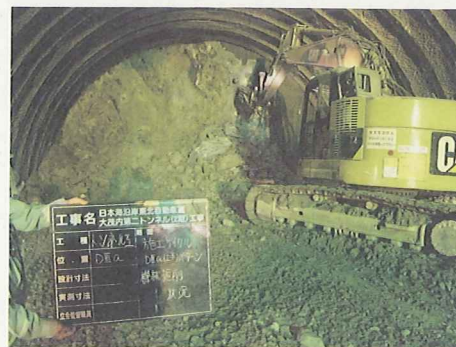
大型ブレイカーによる追加掘削