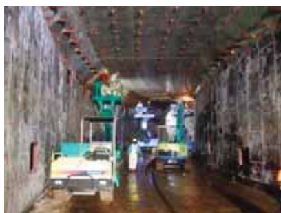
セグメント撤去状況