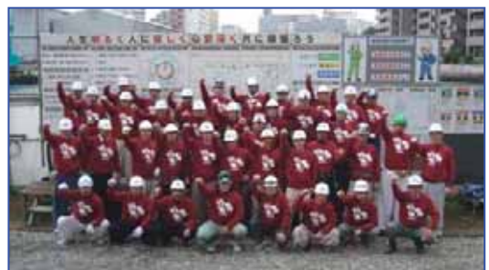
おそろいの愛幸検トレーナーで記念写真！

この状況で推定すると、竣工時点では概ね 0.70kg/m 2 以下になると考えられ、驚異的な成果を上げることが出来ると確信している。