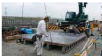
ステンレスパネル大型枠 再利用可能な材料の使用

函体工型枠に再利用可能なステンレスパネルを使用（累計 3,150 m 2 ）や、大型枠化などにより木材使用及びその廃棄物の低減を図っている。