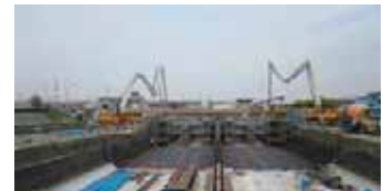
土留支保工を削減した施工

土留構造を切梁式から自立式土留壁（全体施工量の約 90%）とした。これにより当初計画の土留支保工材 1,230t、鋼材消耗品約 50t を削減。さらに、この削減は躯体工施工時の型枠材等資機材の低減にも寄与している。